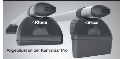
Abgebildet ist der KammBar Pro

Erhältlich in Versionen mit zwei, drei oder vier Trägern. Der KammBar Fleet wird mit einem Montagesatz mit separaten Polstern und Einsätzen geliefert, die speziell für die Befestigungspunkte jedes Nutzfahrzeugs entwickelt wurden.