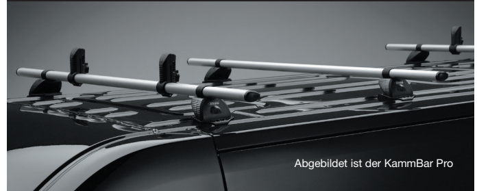
Abgebildet ist der KammBar Pro

Das KammBar-System ist auch in einer Aluminiumversion, dem Kammbar Pro , erhältlich. Er ist standardmäßig mit zwei paar Seitenstützen ausgestattet.