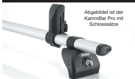
Abgebildet ist der KammBar Pro mit Schlosssätze

Schlosssätze können als zusätzlicher Diebstahlschutz separat erworben werden.